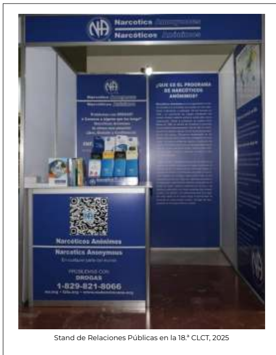
Stand de Relaciones Públicas en la 18.ª CLCT, 2025