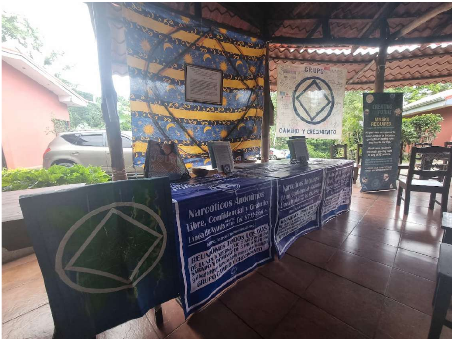
Grupo: Cambio y Crecimiento Costa Rica