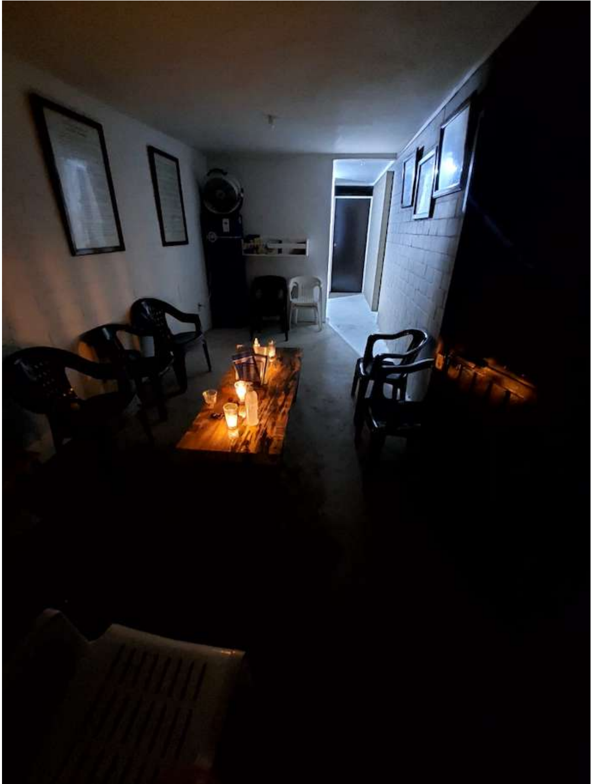
Grupo Doble L Tuxpan, Veracruz, México