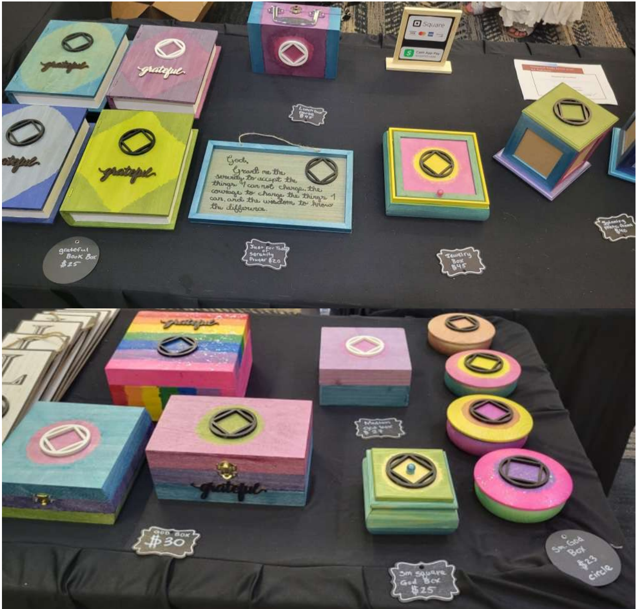
Cajas y Joyeros realizados por compañeras para la Convención Regional en el Paso, Tx.