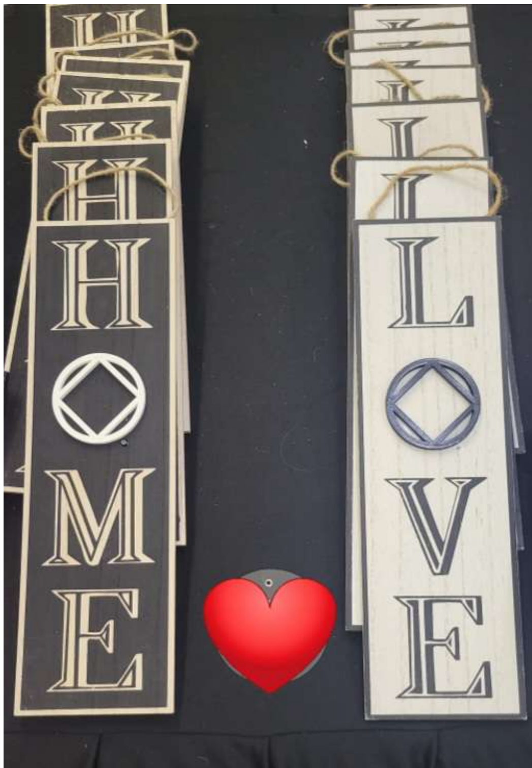
Cajas y Joyeros realizados por compañeras para la Convención Regional en el Paso, Tx.